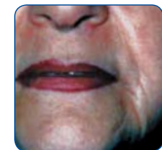
Voor behandeling met Rejuvi