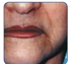
Na behandeling met Rejuvi

Na twee Deep Milk Peel behandelingen zijn de diepe lijnen rond de kaak verminderd.